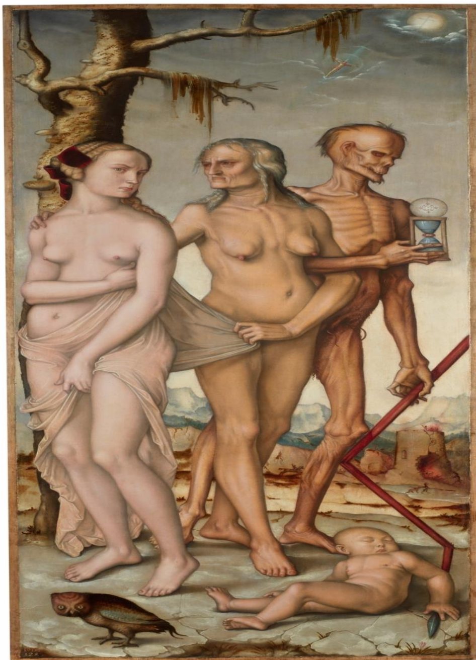
Hans Baldung (1484-1545 Alemania) Año 1510 Renacimiento Museo del Prado Oleo y Tabla