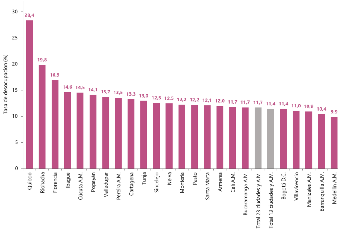
Gráfico 6. Tasa de desocupación según ciudades 23 ciudades y áreas metropolitanas Diciembre 2023 - febrero 2024