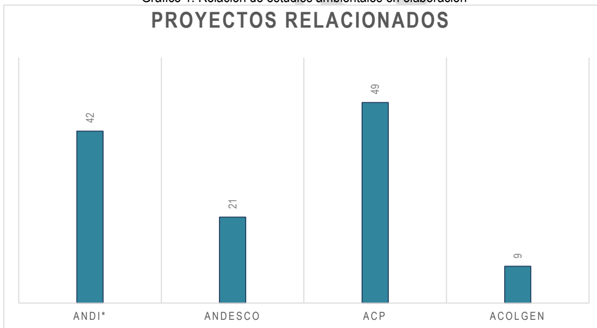
Gráfico 1. Relación de estudios ambientales en elaboración

Nota: Los valores corresponden al conteo eliminando los estudios que fueron presentados por más de una agremiación