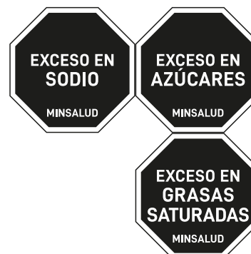
b. Opción 2