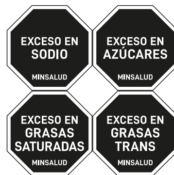
b. Opción 2