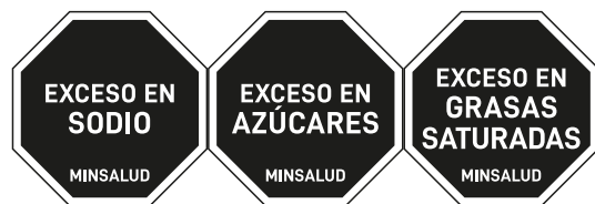
a. Opción 1