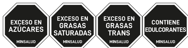
a. Opción 1