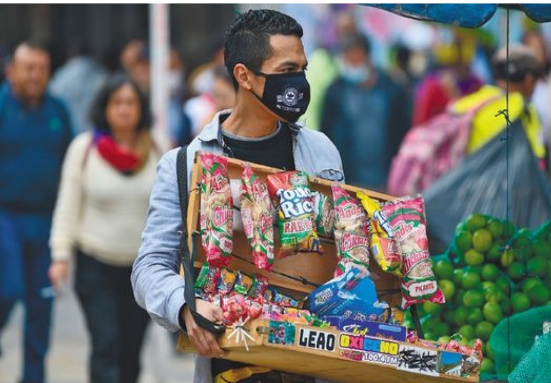
TRABAJADORES AFILIADOS AL SISTEMA GENERAL DE RIESGOS LABORALES CORTE DICIEMBRE 2021 (Fuente de la información: Administradoras de Riesgos Laborales - Ministerio de Salud y Protección Social, Subdirección de Riesgos laborales)