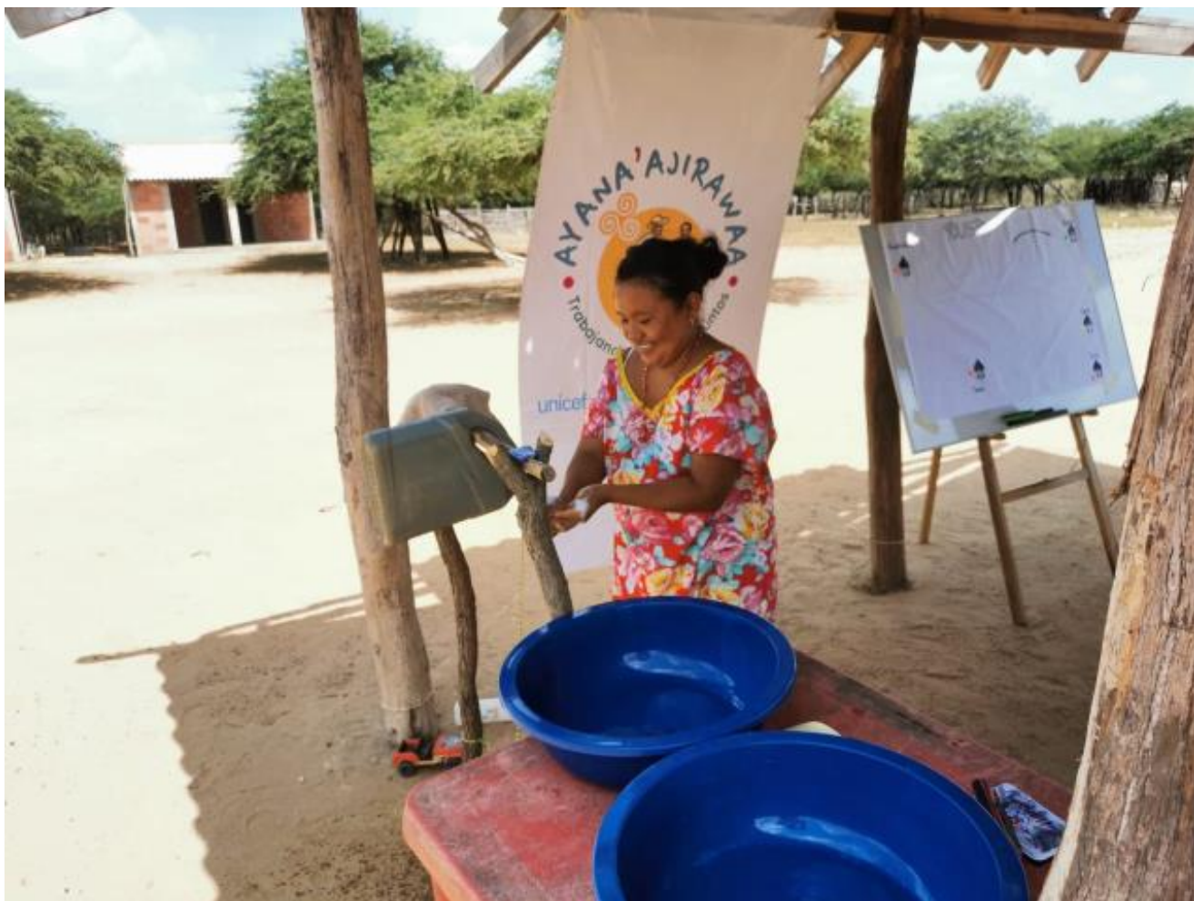
Foto 1: Taller de aplicación de practicas claves de higiene en la comunidad de Youspa municipio de Maicao.