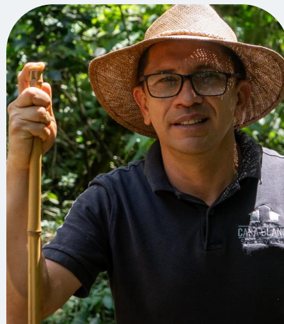
Hacienda Casa Blanca (finca cafetera y ecohotel).