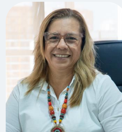
Santander Extremo (agencia de viajes)