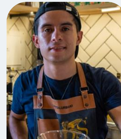
Café bajo sombra (Coffee shop).