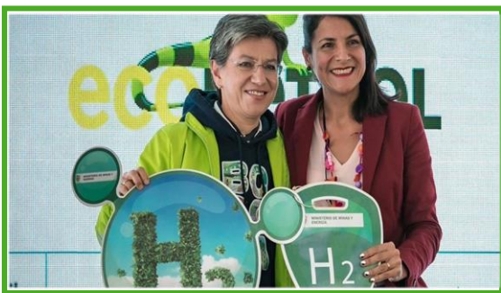
Foto https://www.minenergia.gov.co/ 27 de Marzo de 2023. Minenergía , Bogotá.

Primer bus impulsado con hidrógeno que rodará en Bogotá es presentado por MinEnergía