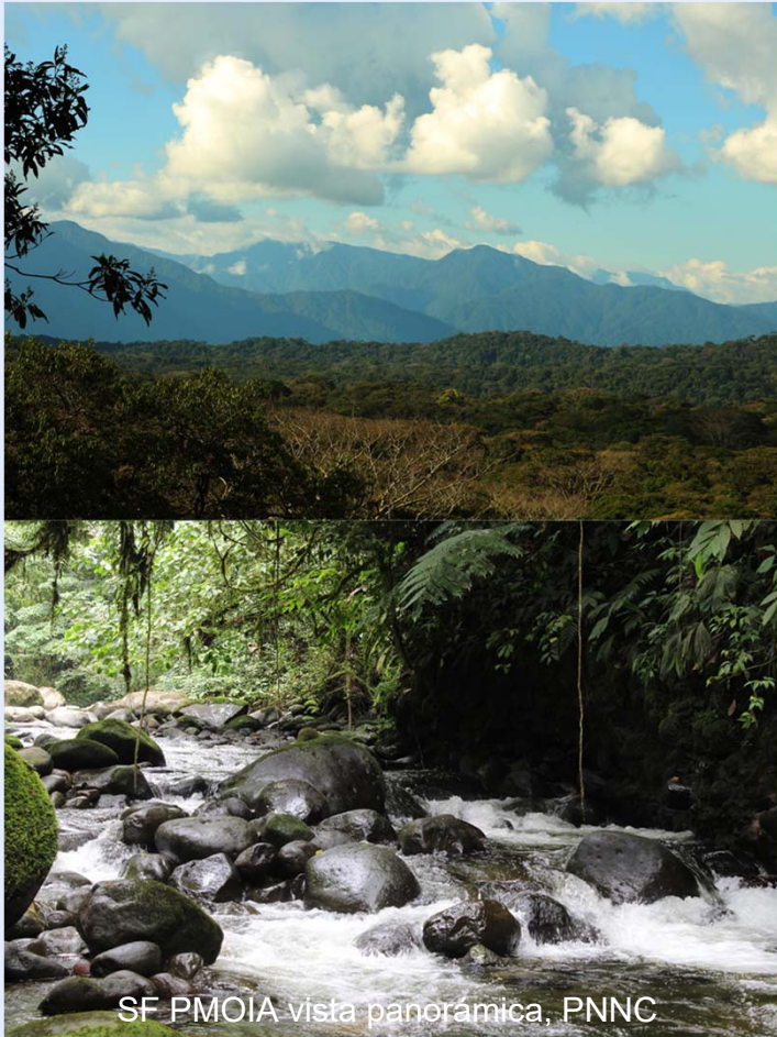
SF PMOIA vista panorámica, PNNC

Educación Ambiental y Comunicación comunitaria: Participación en FICAMAZONIA, red de ecocubles y murales.