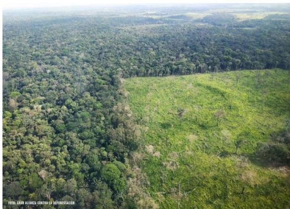
Figura 2. Deforestación en la Amazonía Colombiana.

indicados por el IDEAM, a través la implementación de proyectos sociales dirigidos a producir conservando y a ejercer control para prevenir la deforestación, idea que no solo debería estar enfocada en premiar con más recursos para la reforestación de áreas de territorios que permiten el crecimiento de este flagelo, pues posiblemente hace de los esfuerzos contra la deforestación un círculo vicioso.