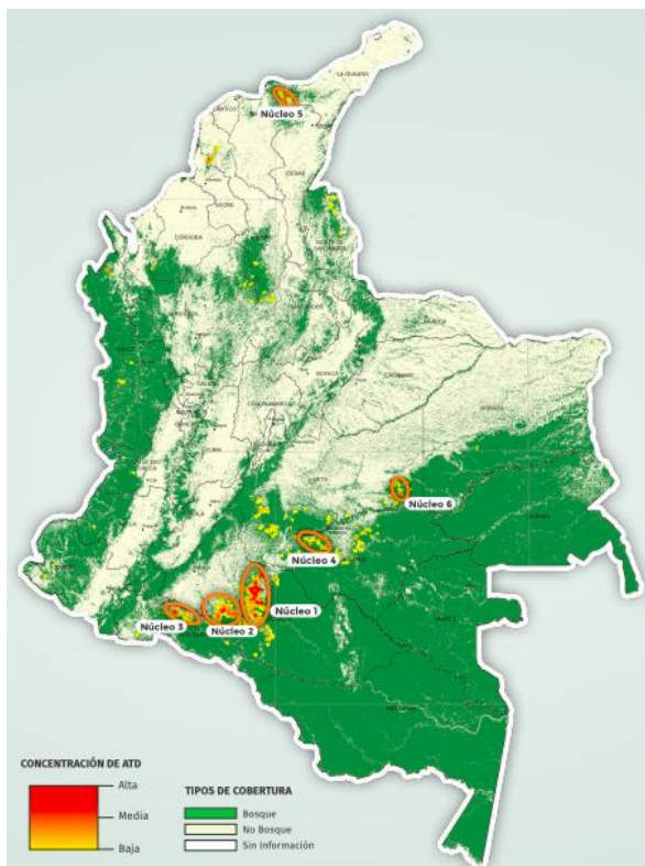
Figura 1. Mapa concentración Alertas Tempranas Deforestación -2018.

Como se puede ver en el mapa 5 del IDEAM, las actividades causantes de la desertización, se extienden en múltiples núcleos como la sierra nevada de Santa Marta, la Serranía de San Lucas, el nudo de Paramillo, la selva de Chocó, sectores de Cauca y Nariño, la región del Catatumbo, sectores de Antioquia, las sabanas húmedas de la Orinoquía y en los departamentos del Meta, Caquetá, Guaviare y Putumayo, donde se concentra la mayor tasa de deforestación, debiendo ser atendidas con prontitud y sentido social, según informes del IDEAM y de la última Cumbre de Gobernadores contra la deforestación.