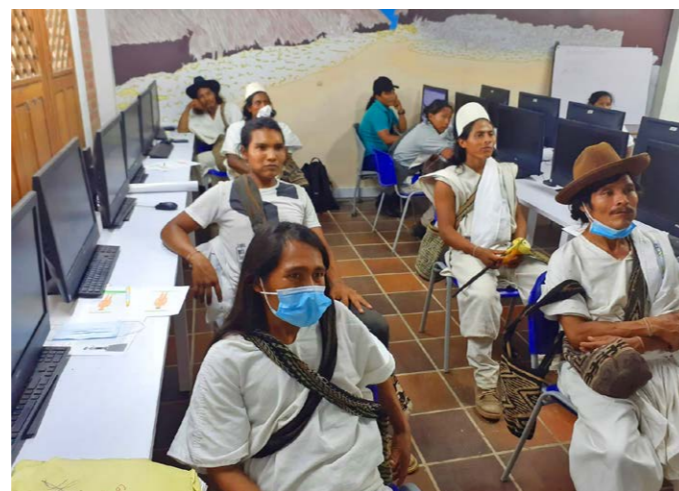
Jornadas de transferencia de conocimiento con miembros de la Tribú Wayúu, zona bananera, Magdalena.