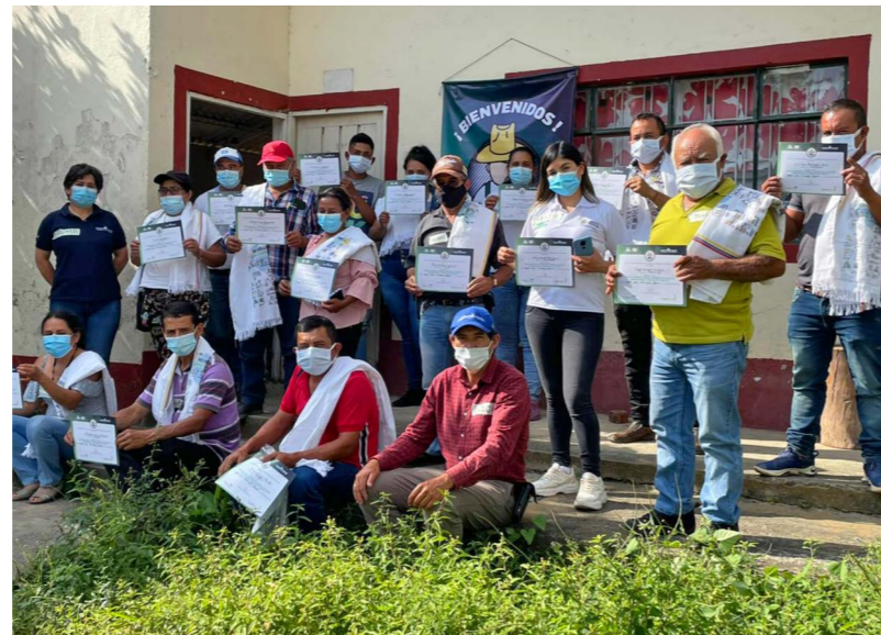
Jornada realizada el 6 de agosto en el municipio de Tununguá, Boyacá.

Con CuidAgro y Mentes Fértiles ampliamos la cobertura a más productores del campo de forma presencial y virtual. Estos programas de protección y nutrición de cultivos lograron transformar el manejo integrado en sus fincas, con resultados que aumentaron su economía y la oferta de alimentos inocuos de excelente calidad para los seres vivos.