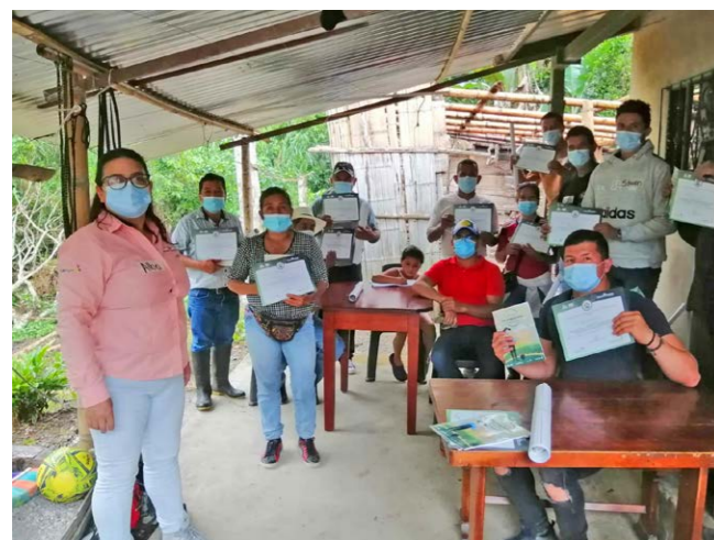
Graduados de nuestros programas en el municipio de Paima, Cundinamarca.