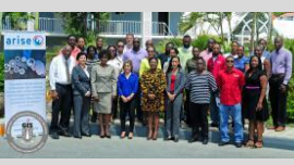
BVI ARISE Network Launch, April 2018.

CEMEX and UNISDR signed the Voluntary Cooperation Agreement for the establishment of the National Chapter in Mexico of the Private Sector Alliance for Disaster Resilient Societies as part of the ARISE Initiative. SELA - Latin American and Caribbean Economic System. November 20 th to 21 st , 2018. Mexico.