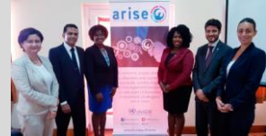
Dominica ARISE Launch, February, 2018